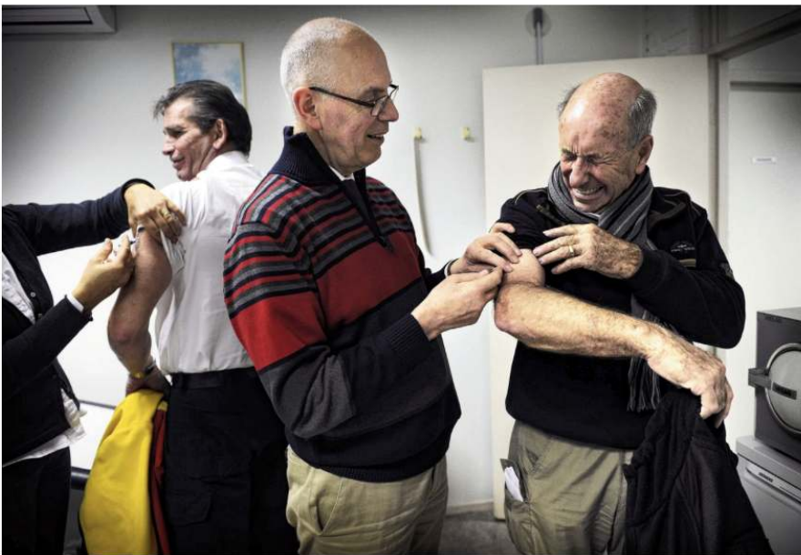
Ouderen in het Gelderse Wijchen krijgen een griepvaccinatie van hun huisarts.